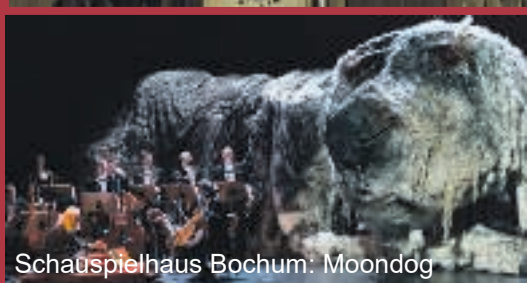
Schauspielhaus Bochum: Moondog