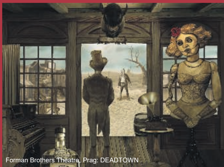
Forman Brothers Theatre, Prag: DEADTOWN

Dukke- objekt og visuelt teater • Silkeborg 9.-12. november 2017 www.festivalofwonder.dk