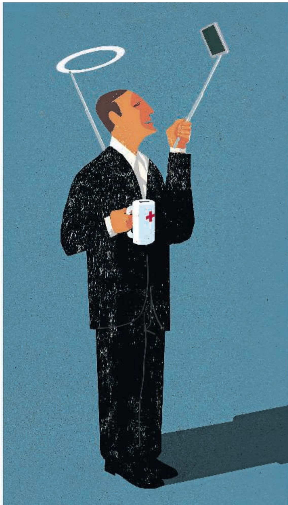
TEGNING: MORTEN VOIGT

For mig handler det ikke om at flashe godhed. For mig handler det om at være en del af et fællesskab, hvor man hjælper andre. Og jo flere der gør det, jo bedre, for så inspirerer man andre. Jeg synes snarere, at det er et problem, at der ikke er flere, der gør det.